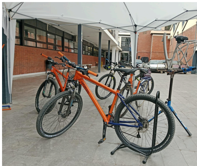
Algunas de las primeras bicicletas reacondicionadas del Hospital de Bicis

El proyecto del hospital de bicis ha servido para dar reconocimiento al alumnado de Básica en la comunidad escolar (“ellos son la UCI del hospital”-comenta José Abril), y fuera de ella. Su repercusión permite soñar con ampliar el proyecto a un proyecto transversal que también incluya resultados de aprendizaje relacionados con los ámbitos.